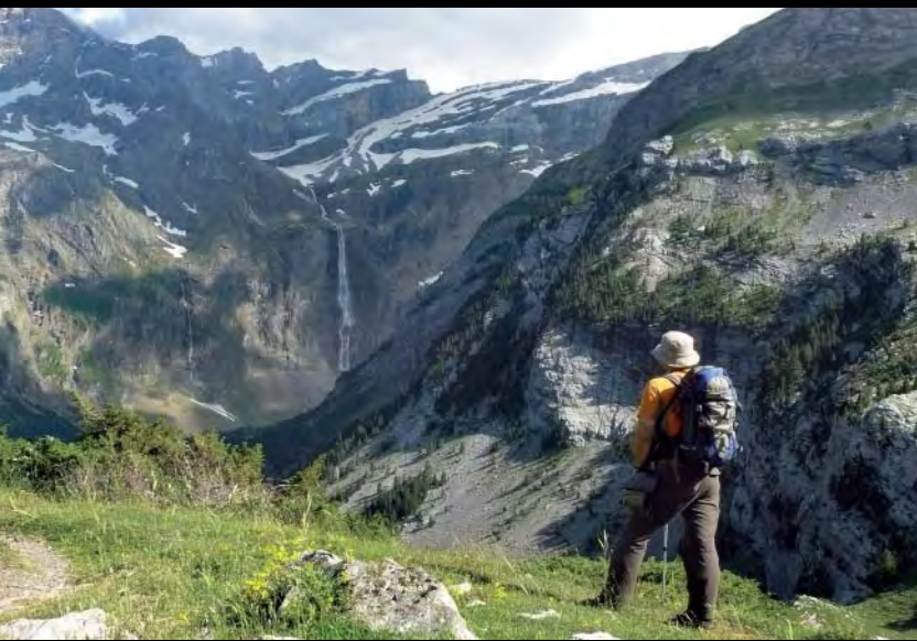
Vista desde Bellevue.