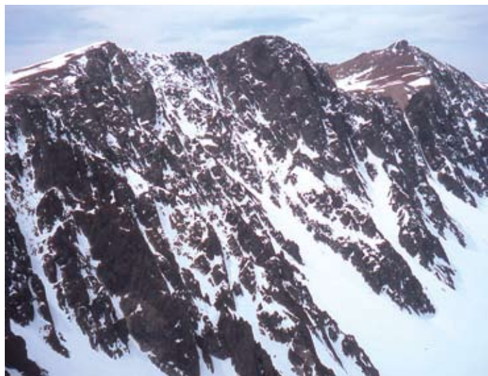
Pic de la Valleta, vertiente N.